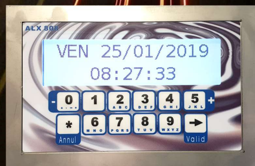
Façade numérique (existe aussi en version anti-vandale)