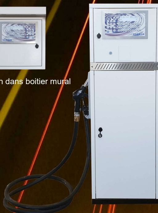
Intégration dans le distributeur