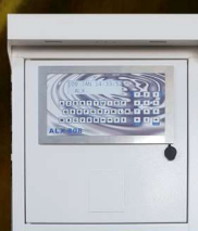
Intégration dans boîtier mural