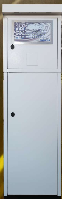
Intégration sur pied borne